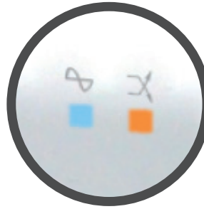
Pantalla LED oculta.