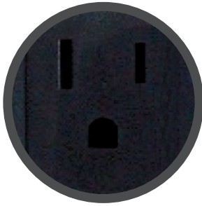
8 Tomas de salida. [4 con AVR - Supresión de picos 4 solo con supresión]

El nuevo y avanzado Regulador de Voltaje Automático R2C, el más completo y de mejor calidad. Este nuevo producto ofrece 8 tomas de salidas, corrige bajas y altas tensiones y proporciona un regulado de 120 o 220 VCA dependiendo el modelo. La pantalla LED oculta, indica energía y voltajes de entrada anormales. La protección Coaxial, varía dependiendo el modelo seleccionado.